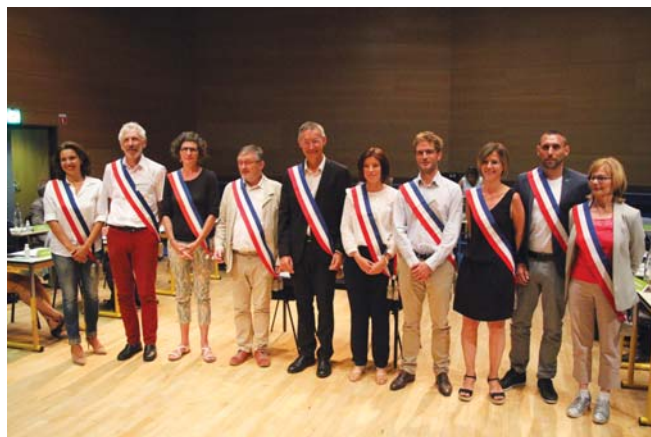
→ Le Conseil municipal a élu 9 adjoints, composant avec le maire le nouvel exécutif de la Ville.