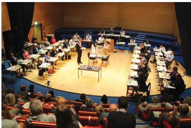
→ C'est dans des conditions dictées par la crise sanitaire que le Conseil municipal s'est tenu le 3 juillet, à la Maison de la musique.