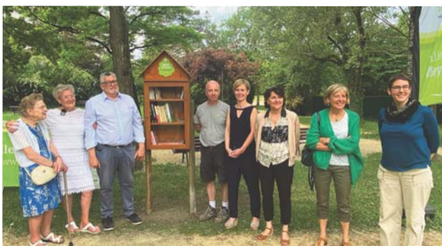
→ Durant le mois de mai, les cinq projets du budget participatif 2021 ont tous été inaugurés. Autant de belles occasions de remercier les porteurs de ces projets pour leur engagement.

Un budget participatif est une forme de partage de pouvoir entre l'exécutif d'une commune, le maire et le conseil municipal, et les citoyennes et citoyens. Cette démarche de démocratie participative consiste à consacrer une partie du budget d'investissement annuel à la réalisation de projets d'initiative citoyenne. Ce sont les habitantes et habitants qui soumettent leurs idées, qui votent pour leurs préférées, et la collectivité s'engage à réaliser toutes celles qui entrent dans l'enveloppe budgétaire dédiée. Chaque idée est étudiée. Si elle respecte bien les principes du règlement, elle est communiquée aux services municipaux pour instruction. En lien direct et constant avec les déposés d'idées, ces derniers s'occupent de les transformer en projets : chiffrage, vérification réglementaire, localisation... toute la technicité des agents de la Ville est mise au service de leur faisabilité. Les idées ayant pu être transformées en projets sont ensuite mises au vote, et ce sont les Meylanaises et les Meylanais qui choisissent leurs préférées. Celles ayant recueilli le plus de voix sont ensuite réalisées.