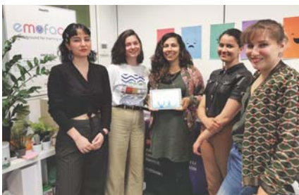
→ L'équipe d'Emoface au grand complet.

Basée au Tarmac, cette startup lance la version smartphone de son application, destinée à faciliter la communication des personnes souffrant de difficultés socio-émotionnelles. Une jeune entreprise qui rejoint la dynamique inclusive de Meylan.