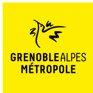
Illustration : Ben Bert — Conception graphique : Améziène Mourret